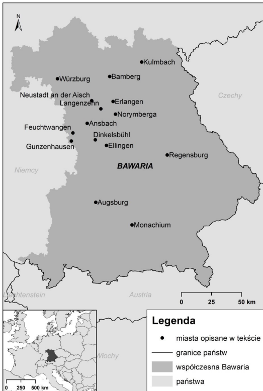
Ryc. 3. Współczesna Bawaria