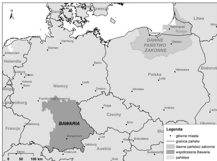
Ryc. 1. Położenie obecnej Bawarii i dawnego państwa zakonnego na mapie Europy Środkowo-Wschodniej

To, co najbardziej jest widoczne w porównaniu Bawarii i południowej części Prus Wschodnich (dzisiejszych Warmii i Mazur), to zieleń lasów i błękit wód (rzek i jezior). Czyste powietrze, liczne szlaki turystyczne, tradycyjna zabudowa wsi, to elementy wspólne. Natomiast północna część Prus Wschodnich (dzisiejszy Obwód Kaliningradzki) jest całkowitym zaprzeczeniem południowej Bawarii. Wysokie Alpy kontrastują z Mierzeją Kurońską i równinami regionu kaliningradzkiego. Jedynie widoki na bezkresne morze rozpościerające się ze skalistego nabrzeża Półwyspu Sambijskiego porównywać można do pejzaży rozpościerających się z alpejskich gór (Dudo 1995: 22–25) (ryc. 1).