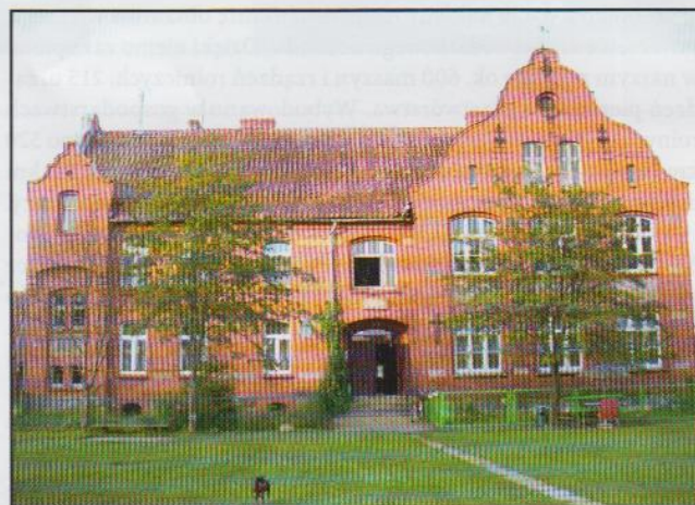
Budynek szkoły we wsi Sąplaty

Po proklamacji Rzeszy Niemieckiej, dzięki obowiązkowi szkolnemu, w Prusach Wschodnich powstała gęsta sieć szkół. W przestrzeni miejskiej do dnia dzisiejszego zachowały się dość typowe, okazałe, często dwupiętrowe budynki szkolne, np. w Olsztynie (przy ul. Mochnackiego, obecnie Szkoła Podstawowa nr 10; przy ul. Jarockiej, obecnie biblioteka publiczna), Żabim Rogu (pow. Morąg), Wysokiej Wsi (pow. Ostróda), Sąplatach i Borkach (pow. Szczytno), Bartołtach Wielkich (pow. Olsztyn), Franknowie (pow. Reszel).