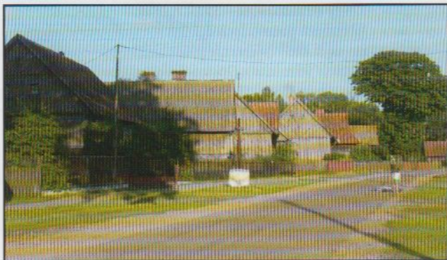
Typowa XIX-wieczna zabudowa wsi Klon

W połowie wieku XIX nastąpiły na wsi wschodniopruskiej przemiany społeczno-agrarne spowodowane separacją i komasacją gruntów. Dotychczasowa zwarta zabudowa wsi uległa przemianom, ponieważ podzielono na odrębne działki dotąd wspólne pola i pastwiska służące do wypasu bydła, znajdujące się nawet kilka kilometrów od wsi. Powstała wówczas tzw. zabudowa kolonijna, czyli pojedyncze gospodarstwa powstające co prawda w granicach wsi, ale w dużym oddaleniu, zwane też wybudowaniami, wymiarami, a w gwarze warmińskiej plonami. W samej wsi – od średniowiecza funkcjonującej w formie ulicówki lub okrężnicy – w związku ze znacznym przyrostem ludności, zaczęto wytyczać nowe drogi. Powstał nowy typ układu wsi, tzw. wielodrożnica.