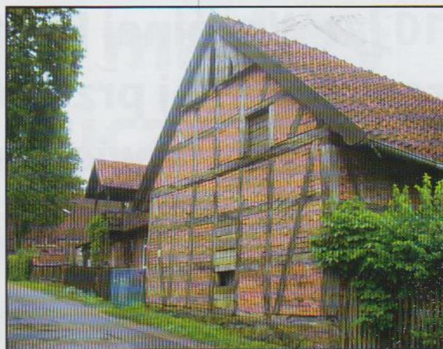
Nowe Kawkowo - przykład muru pruskiego

Budowano także w stylu muru pruskiego, czyli ściany szkieletowej z ułożonymi na skos belami drewnianymi wypełnionymi czerwoną cegłą. Spotykano także konstrukcje szachulcowe, gdzie wypełnienie nie było ceglane tylko z trzciny lub słomy wymieszanej z gliną. W późniejszych czasach wypełnienia te czasami pokrywano tynkiem i białkowano, stąd dzisiaj trudno jest odróżnić typ muru pruskiego od szachulcowego. Szczyty domów zdobiły artystycznie wykonane pazdury. Obramowania okien i drzwi były malowane na seledynowo lub niebiesko i również zdobione charakterystycznym ornamentem.